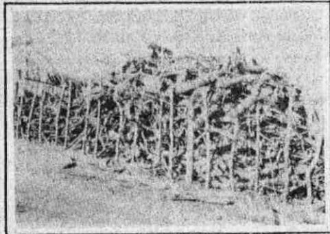
...extraído para lenha...

Assim, os caranguejos estão sendo extintos. A exploração do mesmo é feita de maneira violenta, desordenada, interessando aos cada vez mais ricos a pesca das fêmeas para não atrapalhar no lucro. Não se res-