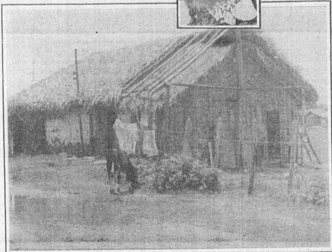
Residência de d.Vera Lúcia - Rua do Urubu - Bairro Cantagalo