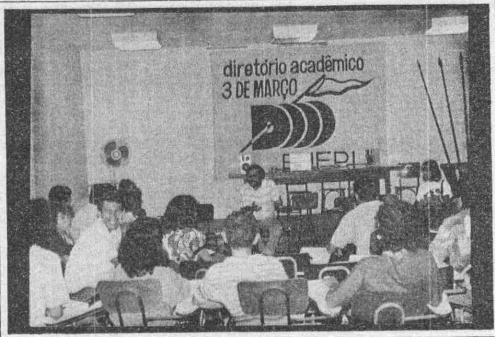
Diretório Acadêmico estimula debates.