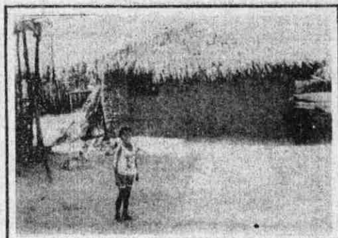
...construção de casas...

Por Teófilo de L. Maia Texto Final: R. Costa