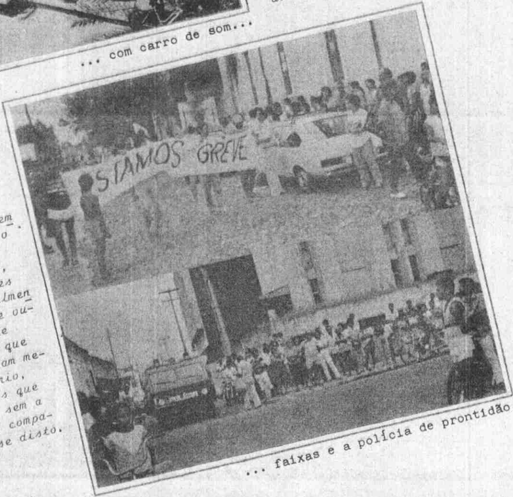
... faixas e a polícia de prontidão.

A população de Parnaíba, embora assustada e temerosa com o movimento (que foi inédito!), deu total apoio aos bancários, considerando as reivindicações por demais justas e principalmente entendendo que não existe outra forma, senão a greve, de pressionar os patrões para que os exorbitantes lucros sejam melhor divididos. É necessário, portanto, que os bancários que resistiram ao movimento, sem a mínima solidariedade aos companheiros, conscientizem-se disto.