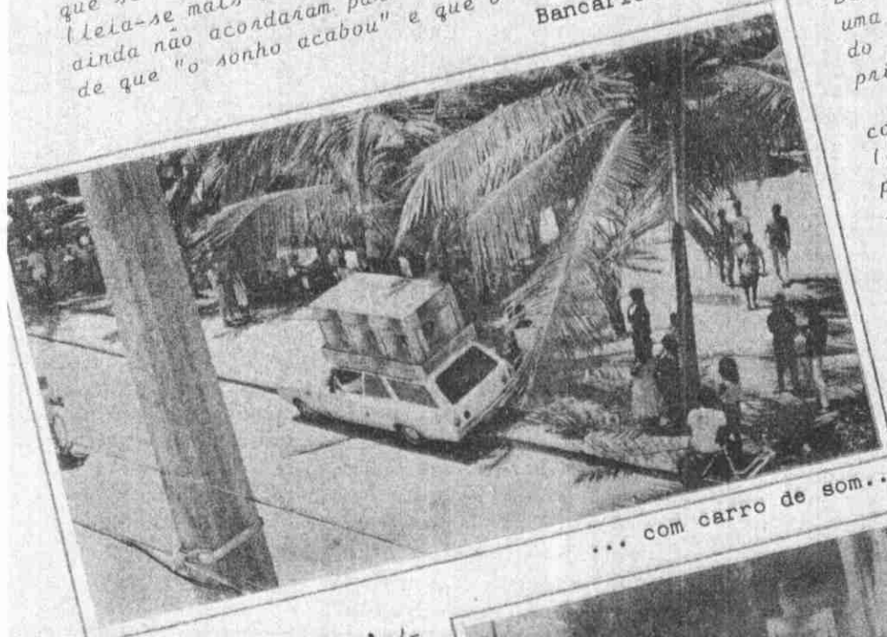
... com carro de som...

Mas a greve valeu à pena. E como valeu! Pela segunda vez (a primeira foi a queima dos tapumes) a Praça da Graça tornou-se palco de um movimento bonito, autêntico, democrático e justo que parou e ao mesmo tempo movimentou a cidade sem a demagogia dos falsos políticos ou o excessivo otimismo patriótico dos tecnocratas da City. A adesão à greve por parte dos outros bancos, foi de 100%.