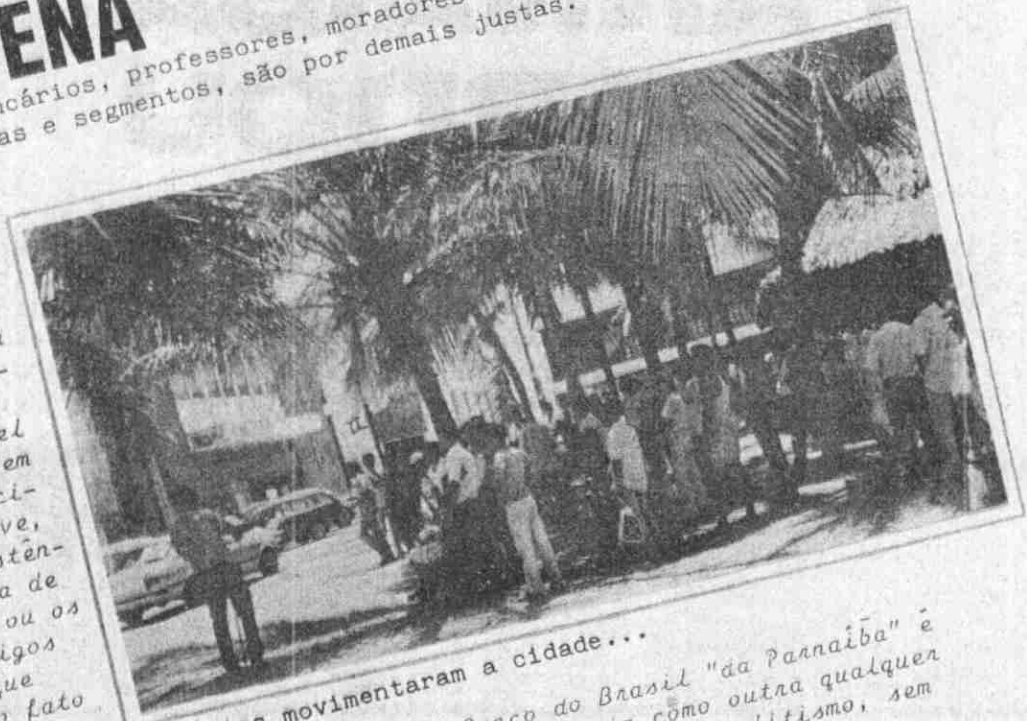
Bancários movimentaram a cidade...

O Banco do Brasil, a nível nacional, tomou a iniciativa, em assembleia geral, e ficou decidido pela deflagração da greve, embora houvesse alguma resistência por parte de uma minoria de funcionários comissionados ou os que se consideram mais antigos (leia-se mais arcaicos), que ainda não acordaram para o fato de que "o sonho acabou" e que o