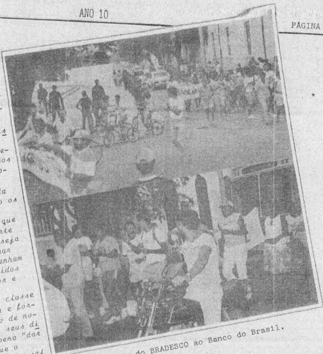
Passeata do BRADESCO ao Banco do Brasil.

Temos certeza que a classe se sente mais encorajada e fortalecida para o reinício de novas lutas em defesa dos seus direitos, não valendo a pena "dar o sangue" pelo banco que o transformará em lucro não o salvando da morte por anemia profunda.